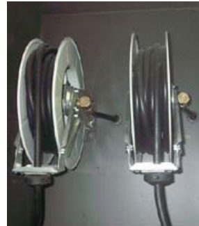
Distributeurs air et eau